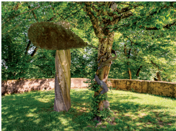
Giuseppe Penone, Souffle végétal , 1985.