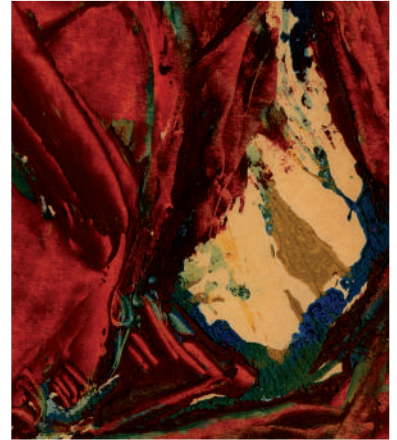
Joëlle de La Casinière, Sans titre , 1963, huile sur page d'agenda, 12,5 x 7 cm. Photo : Joëlle de La Casinière.