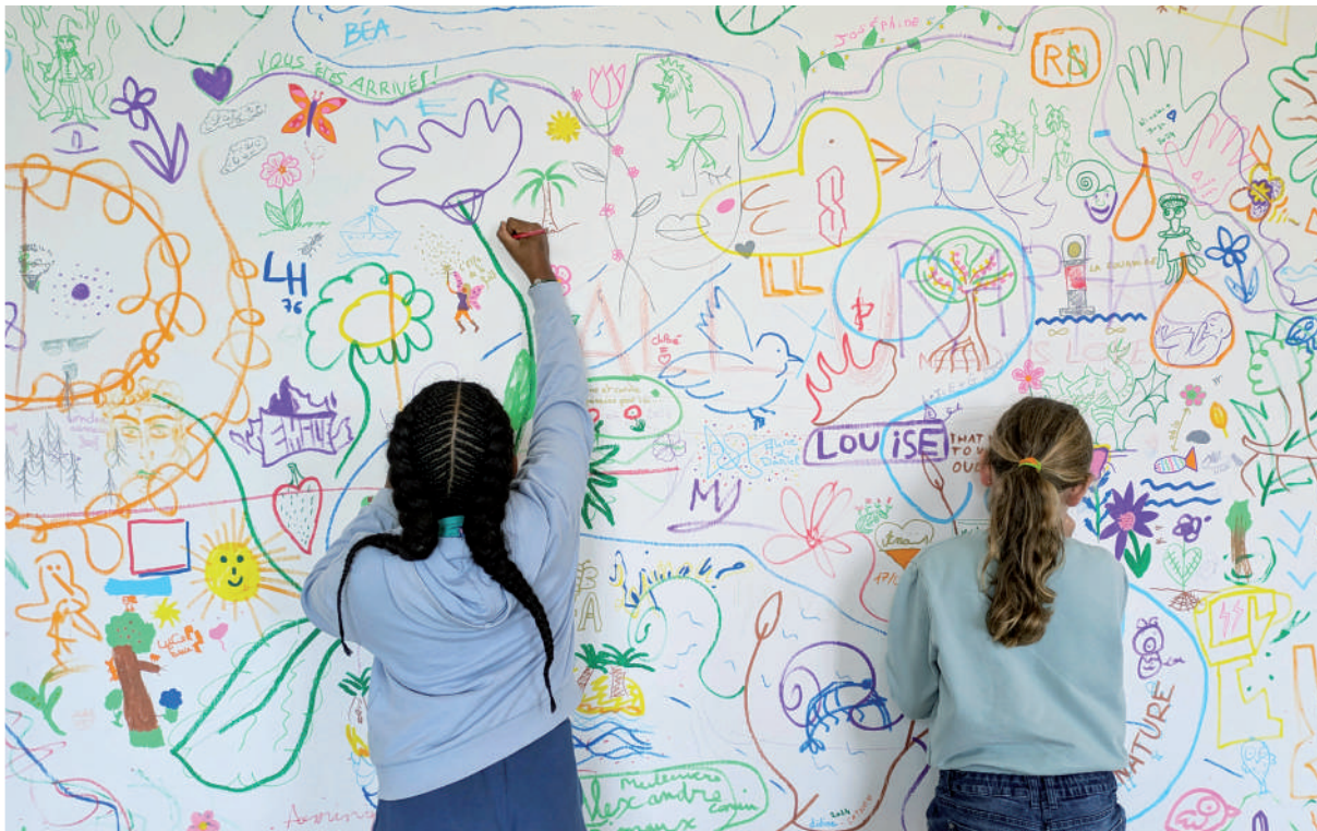
Vue de l'atelier du service des publics, 2024.