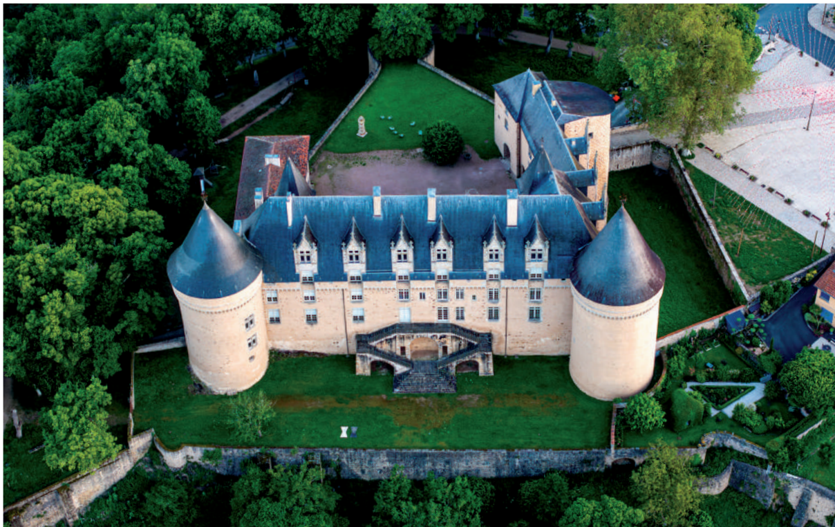
Vue du château de Rochechouart, 2024.

Le Musée d'art contemporain de la Haute-Vienne – château de Rochechouart détient depuis décembre 2023 les quatre labels « Tourisme et Handicap », le service des publics travaille à renforcer l'accueil et l'accompagnement de tous les publics. Le musée est adapté aux nécessités des personnes en situation de handicap et à mobilité réduite, dyslexiques, âgées ou allophones. Les espaces historiques du château ainsi que les salles du musée sont entièrement accessibles par ascenseurs et des équipements adaptés d'aide à la visite sont disponibles gratuitement. Le personnel du musée est également formé aux publics spécifiques désirant visiter le château. Des visites ainsi que des activités pensées selon les handicaps peuvent être réalisées sur rendez-vous pour les groupes, soit durant les horaires d'ouverture du musée soit sur des horaires dédiés. Une personne référente accessibilité est en charge de ces visites.